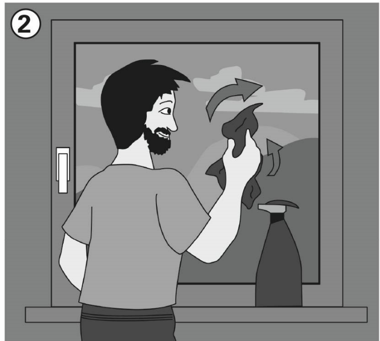
2 Fensterscheibe vorher reinigen und mit Wasser einsprühen.