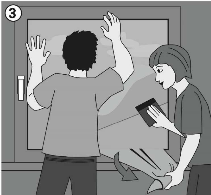
3 Schutzpapier entfernen und Folie anbringen.